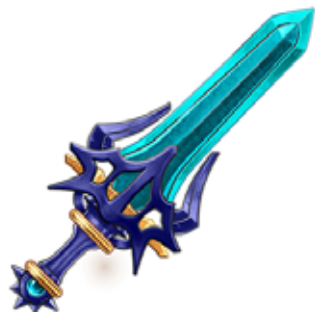
イベント メインクエスト 「塔の最上階を調査しよう(力)」報酬 ★4「碧紅双剣ラルジュ」

「塔の 10 階を調査しよう」「塔の 25 階を調査しよう」などのイベント メインクエストをクリアするごとにオシャレ装備ガチャ券やレアガチャ券が貰えます！