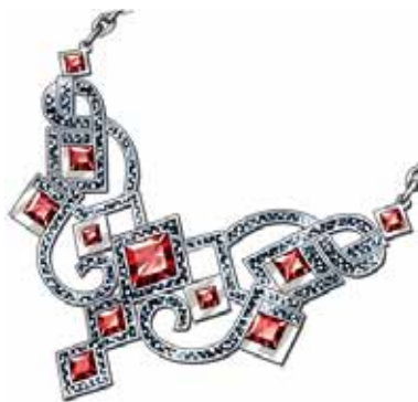
★4「ロイヤルネックレス」