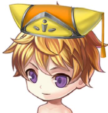
イベント メインクエスト 「塔の最上階を調査しよう(魔)」報酬 ★4「トラントローブ -頭-」