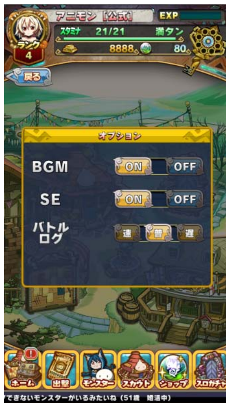
バトルログ設定画面