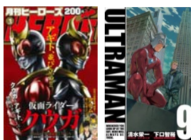
© 石森プロ・東映 © 清水栄一・下口智裕／ヒーローズ © 円谷プロ

コミック誌『月刊ヒーローズ』を中心に、引き続きヒーローIP の創出に注力しています。また、電子書籍プラットフォームにおいて、国内外で配信方法の多様化や新たなパートナーシップの構築を進めています。