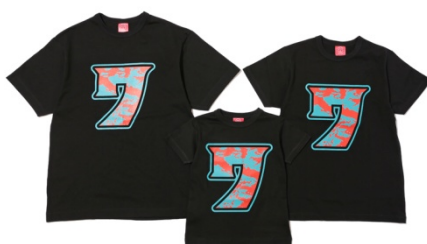
<OJICO> ウルトラ怪獣モチーフ親子 Tシャツ(ウルトラセブン) 3,672 円~5,400 円(税込)