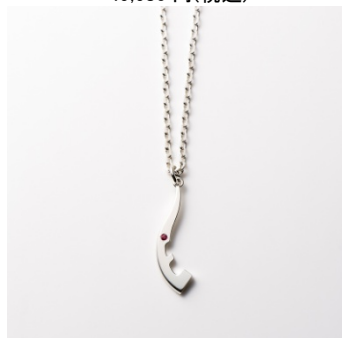
<U-TREASURE by KUNO> アイスラッガーペンダント(ルビー) 21,600 円(税込)