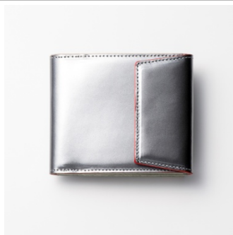
<JUNYA WARASHINA> 本革折財布(ウルトラマン) 39,960 円(税込)