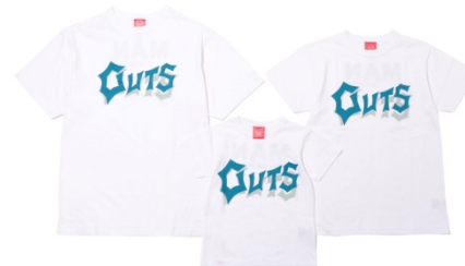
<OJICO> ウルトラ怪獣モチーフ親子 Tシャツ(ガッツ星人) 3,672 円~5,400 円(税込)