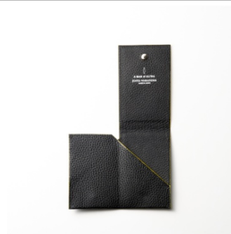
<JUNYA WARASHINA> 本革カードケース(ゼットン) 29,160 円(税込)