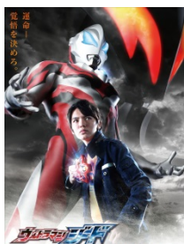
『ウルトラマンジード』 © 円谷プロ © ウルトラマンジード製作委員会 ・テレビ東京

『ウルトラマンシリーズ』は、平成 28 年にシリーズ放送開始 50 年を迎えました。当社グループでは、子供から大人まで世代を問わず愛され続け、日本を代表するヒーローキャラクターへと成長した『ウルトラマンシリーズ』を、国内外のパートナーと協働でクロスメディア展開しています。