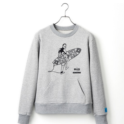
A MAN of ULTRA サーフスウェット 14,000円(税抜)