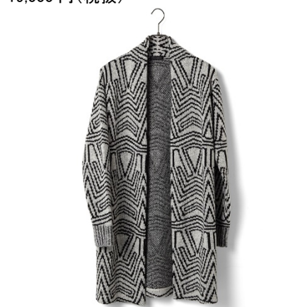
TETE HOMME ニットガウン(ダダ) 24,000円(税抜)