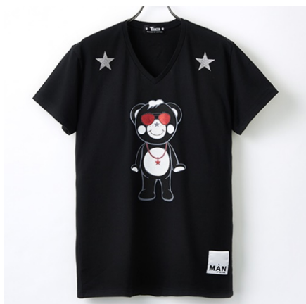
TANTA(西武池袋本店先行販売) グリッターTシャツ 22,800円(税抜)