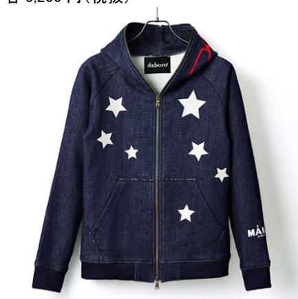
daboro デニム風パーカー(ウルトラセブン) 35,000円(税抜)