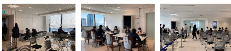
受付・書類確認（書類記入場所・受付・待機の模様）