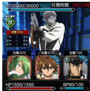
コンボスキルが発動するマルチ任務