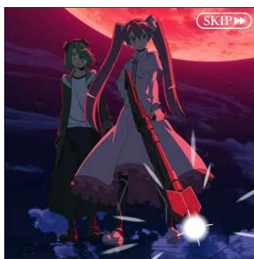
プレイヤーが初めてナイトレイドと出会うオープニングシーン