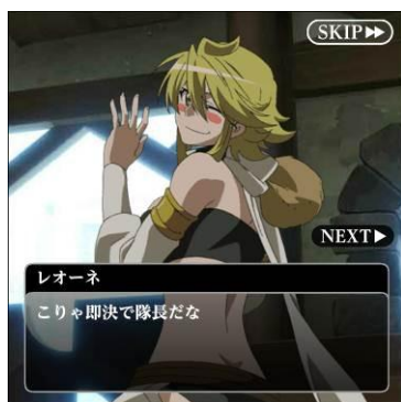
アニメからのシーンも多数登場