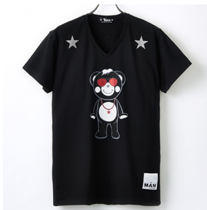
TANTA(西武池袋本店先行販売) グリッターTシャツ 22,800円(税抜)