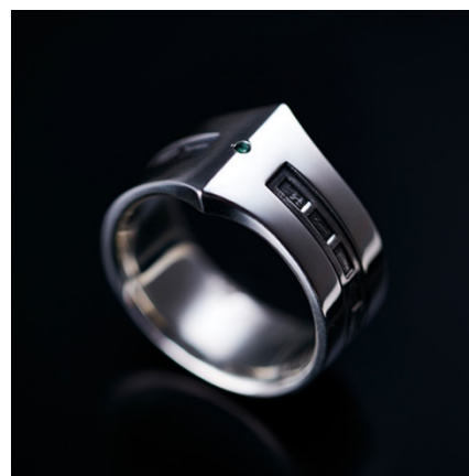
PUERTA DEL SOL(西武池袋本店先行販売) ウルトラセブンリング TYPE-1(エメラルド) 19,000円(税抜)