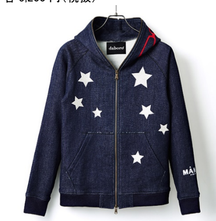
daboro デニム風パーカー(ウルトラセブン) 35,000円(税抜)