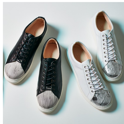
Bluestone(西武池袋本店先行販売) レザースニーカー(墨流し/アルミ型押し) 各 59,000円(税抜)