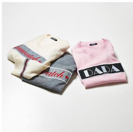
LOVELESS カシミアセーター(shuwatch/DADA) 各 33,000円(税抜)