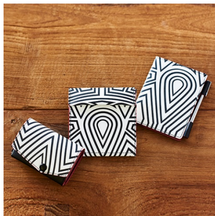
abrAsus 小さい財布/薄い財布/薄いメモ帳(ダダ) 13,889円/16,852円/ 7,222円(税抜)