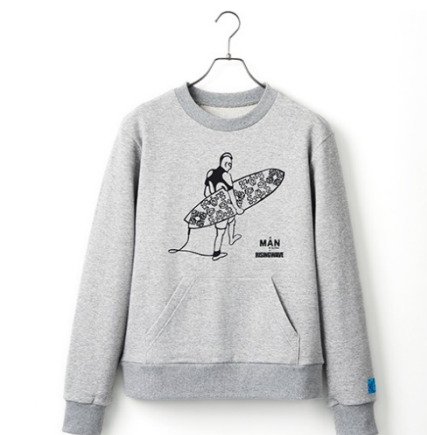
A MAN of ULTRA サーフスウェット 14,000円(税抜)