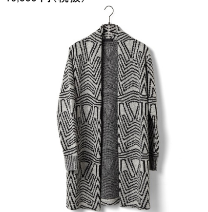
TETE HOMME ニットガウン(ダダ) 24,000円(税抜)